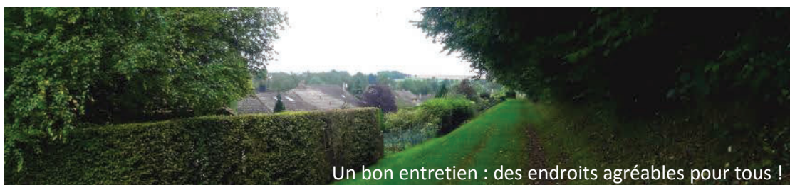
Un bon entretien : des endroits agréables pour tous !

L'entretien des espaces verts passe également par la destruction de certaines plantes envahissantes et en premier lieu les chardons qui doivent être coupés avant le fleurissement.