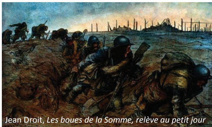
Jean Droit, Les boues de la Somme, relève au petit jour

On croyait avoir tout vu à Verdun, mais le 1 er juillet au matin est déclenchée la bataille de la Somme : de tous les continents, on vient mourir en terre picarde. Le 1 er juillet 1916 est le jour le plus sanglant de l'histoire de