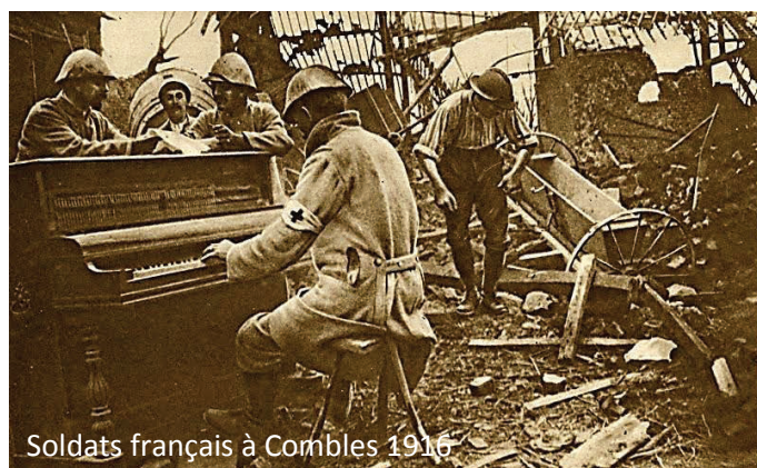
Soldats français à Combles 1916 réalité est parfois bien cruelle...