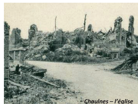
Chaulnes - l'église