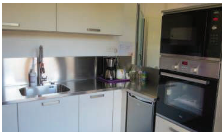
La cuisine du Centre

De nouveaux projets Santé et Nutrition sont en réflexion. Ce nouvel équipement permettra leur mise en place.