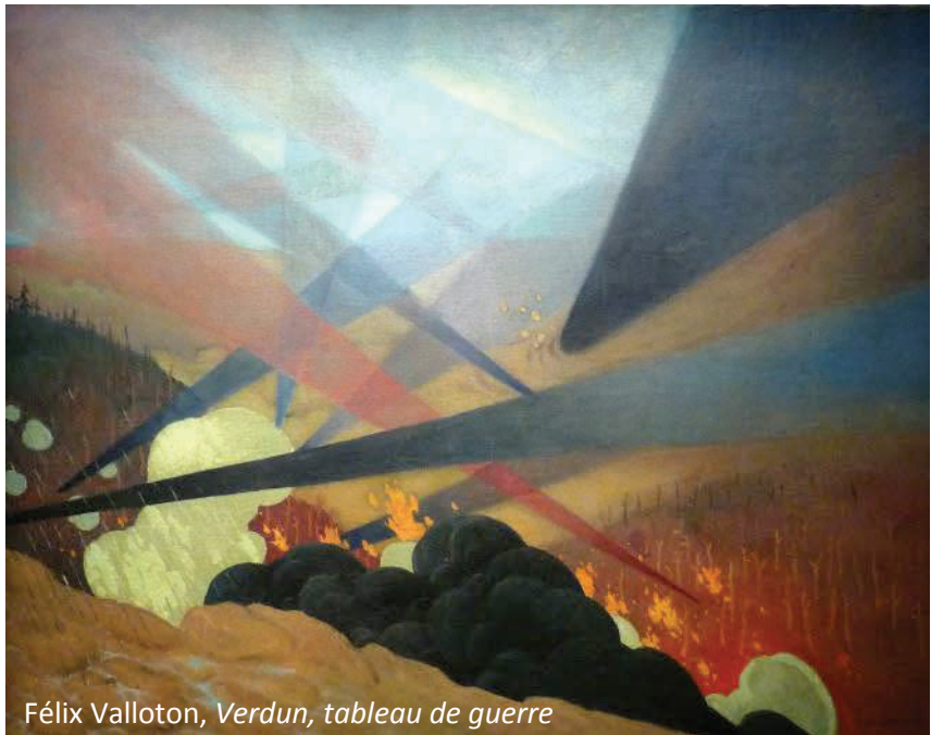
Félix Vallotton, Verdun, tableau de guerre

Mais le 21 février 1916 à 7h15, le ciel s'embrase pour 10 mois de combats inhumains. Tous les 10m, un canon lourd allemand crache ses obus : on estime qu'un million d'obus se sont abattus sur les 12 km de front ce 21 février. Les survivants résistent héroïquement, retardent la poussée allemande et empêchent une percée dévastatrice. Malgré tout, le fort de Douaumont est pris le 25 : il est le symbole de cette bataille, et il sera l'objectif de reconquête des Français jusqu'en décembre.